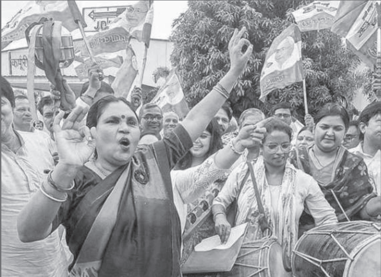
JD(U) workers and supporters celebrate after the declaration of Bihar's caste-based census report, in Patna, on October 4, 2023.

The Census Act, 1948 should be amended to make enumeration by caste mandatory, instead of leaving it to the whims of the Union executive. Such data can be collected as part of the regular Census, with a few pertinent queries added to the questionnaire