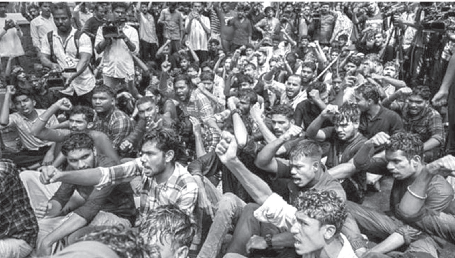
Students' Federation of India (SFI) activists shout slogans during a protest over the alleged irregularities in NEET-UG exams 2024.

The goal of examination reform should be to ensure that people from disadvantaged sections are adequately represented in the medical field and they can contribute to making healthcare accessible to their communities